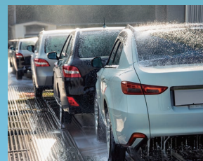
年末洗車場の渋滞

SDGsの推進により、各業界で水資源の保全意識がさらに高まる一方、すでに日常生活の一部として当たり前に行われる「洗車」による膨大な水使用の現状にも、環境資源を大切にするために危機意識を向けなければなりません。