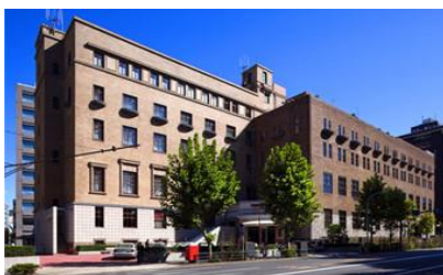
パーティ会場 学会会館

◆問い合わせ先 協会事務局（株）アイラム TEL03-5577-6764 メール；info@irham.co.jp